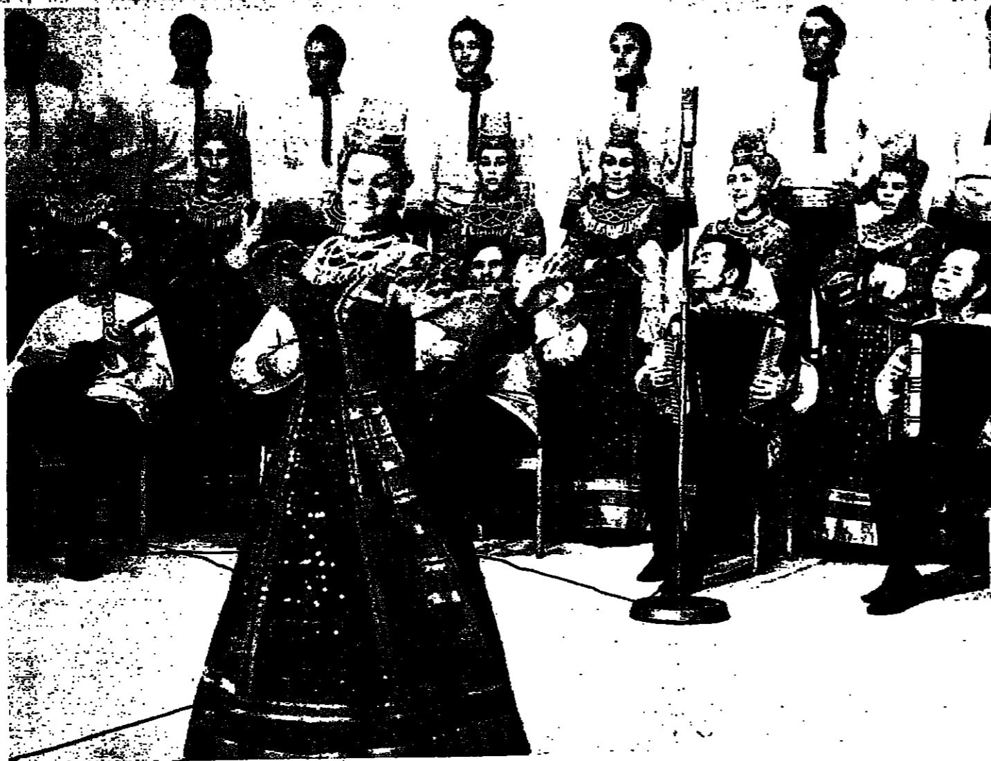
رقصة فولكلورية تؤديها ابوديمستروكوفا

اطلق على قسطنطين صغر ولد في مدينة حيوانات قرب تل ابيب يوم تصديب الرئيس الاسرائيلي الجديد جيس كارتز في الاسبوع الماضي ، اسم ابني ابنة الرئيس .